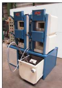
Voir notice n°96/a See bulletin n°96/a

Toutes ces données techniques sont susceptibles d'être modifiées sans préavis. Liste de références sur demande. Devis sans engagement.