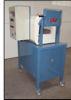
Easylab 304 S/Z, 1 200°C

(dimensions intérieures identiques au modèle 304 S)