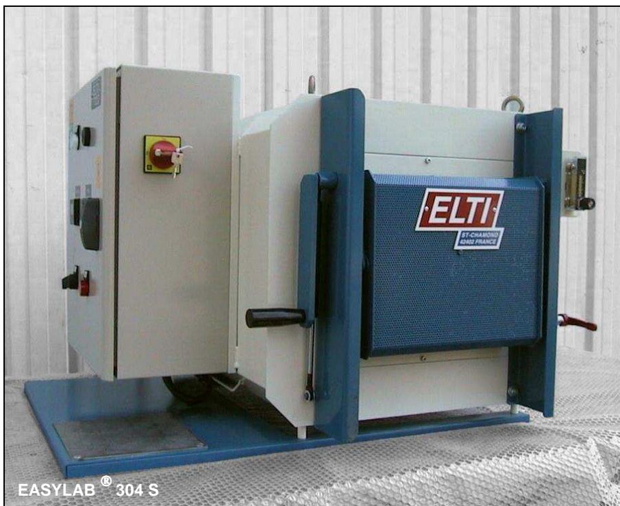
EASYPAR ® 304 S

Bench electric furnaces for workshops and laboratories with or without protective atmosphere